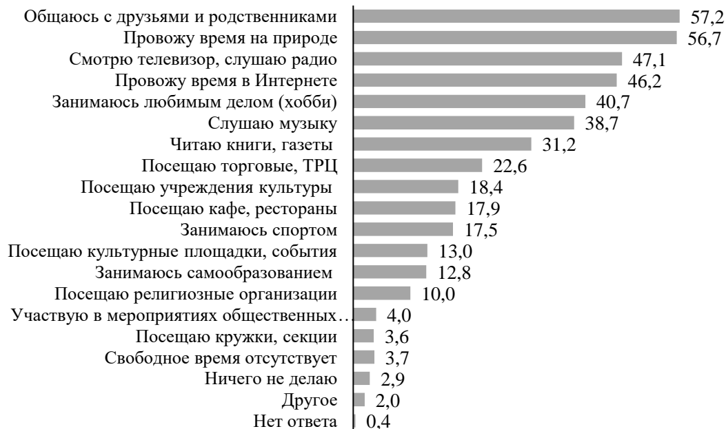
Рисунок 1 – Предпочтительные формы проведения досуга респондентами в 2023 г., % от общего числа ответов

Анализ предпочтений респондентов относительно способов проведения досуга в зависимости от социально-демографических характеристик позволил выявить ряд особенностей. В рамках гендерного анализа было обнаружено, что женщины проявляли интерес к более широкому спектру досуговых практик, которые отличались разнообразием форматов. Наиболее значимые различия в долях ответов между женщинами и мужчинами зафиксированы по таким видам досуга, как проведение времени с родными и близкими – 62,1 % (среди мужчин – 51 %), проведение времени на природе – 60,6 % (среди мужчин – 51,7 %), чтение книг, журналов – 37 % (среди мужчин – 23,9 %), посещение торгово-развлекательных центров – 26,9 % (среди мужчин – 17,1 %), посещение учреждений культуры – 23,6 % (среди мужчин – 11,8 %), религиозных организаций – 13,1 % (среди мужчин – 6,1 %).