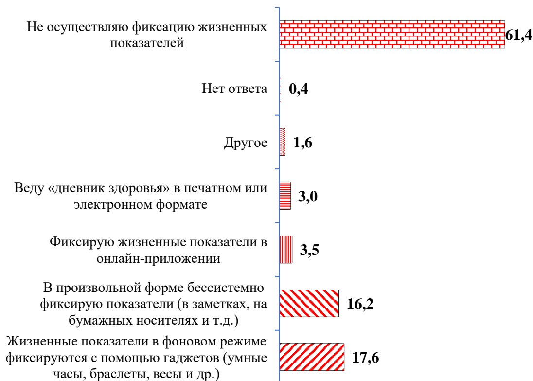
Рисунок 2 – Распределение ответов на вопрос о применении практик, позволяющих осуществлять мониторинг жизненных показателей, %

практик 61,4 % участников исследования, затруднились ответить 0,4 % (рисунок 2).