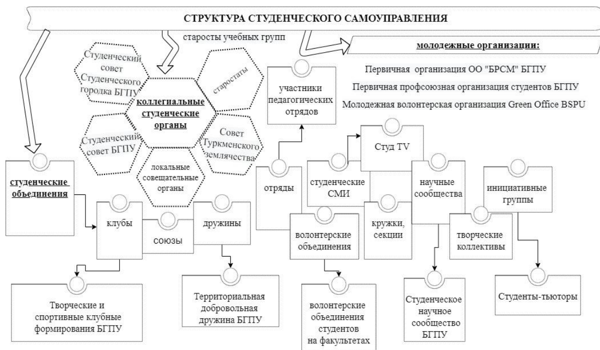
Рисунок 2. – Структура студенческого самоуправления (на примере БГПУ имени М. Танка)

Данная структура является гибкой, открытой и динамичной, включает множество форм самоорганизации обучающихся, способна к дополнению, совершенствованию, «достраиванию». Интенсивное развитие инфраструктуры студенческого самоуправления создает предпосылки для появления новых видов общественной нагрузки – администрирование социальных сетей факультета, помощь в создании и продвижении интернет-канала университета и др. Это значит, что структура студенческого самоуправления не может являться статичной, неизменной системой, она должна быть мобильной, способной к достраиванию, появлению новых форм, отвечающих запросам современности, трансформироваться с учетом интересов студентов конкретного учреждения высшего образования.