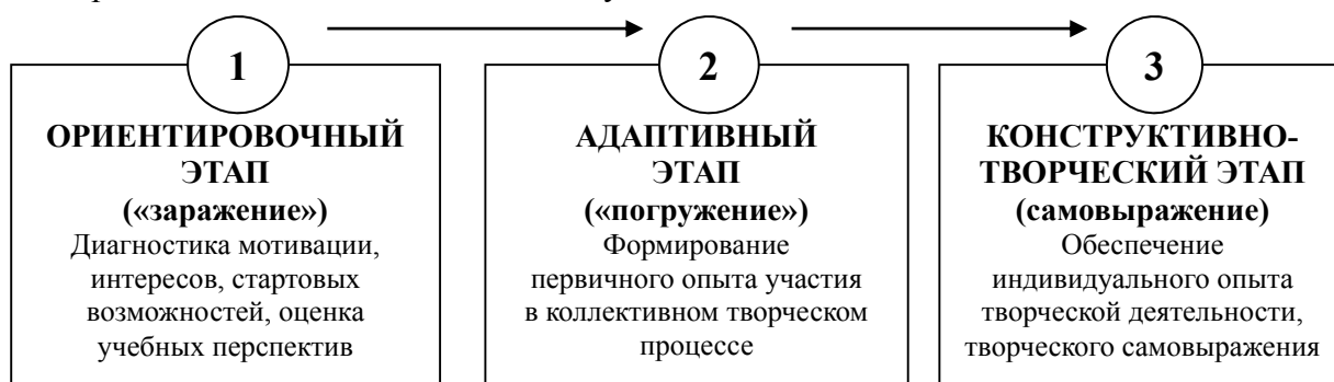
Рисунок 3. – Этапы реализации педагогической технологии формирования творческой направленности старшего дошкольника во внешкольном учебном учреждении

Представленный на рисунке 3 ориентировочный этап соответствует моменту знакомства ребёнка с педагогом и самим внешкольным учебным учреждением. Приход на занятия большинства воспитанников в возрасте 5-ти лет реально обусловлен выбором родителей (87%), значительно реже советом педагогов дошкольного учебного заведения (7%). Обычной также практикой (82%) является подготовительная беседа, неоднократно проводимая родителями с ребёнком о том, «как интересно в Доме школьников», с целью минимизировать возможный сценарий отказа от занятий. Этому способствует опыт, полученный большинством родителей на этапе адаптации ребёнка к посещению детского сада. Таким образом, можно сделать вывод о том, что пропедевтическая работа по подготовке ребёнка к первому визиту во внешкольное учебное заведение проводится относительно благополучно.